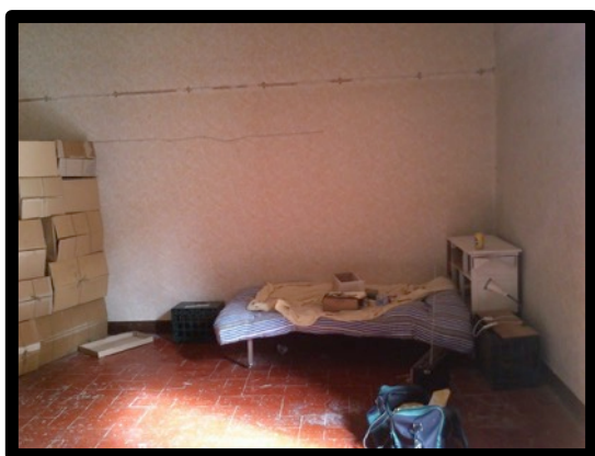
(5 x 3m.) Espai d'actuació. Llit del rei Gaspar.

Recomanem una sala amb una dimensió total de 6m x 9m de profunditat, que inclou l'espai d'actuació de 5m x 3m de profunditat i l'espai de públic que contindrà l'aforament d'unes 25 a 30 persones. Les mesures d'aquest espai poden variar per contenir més aforament.