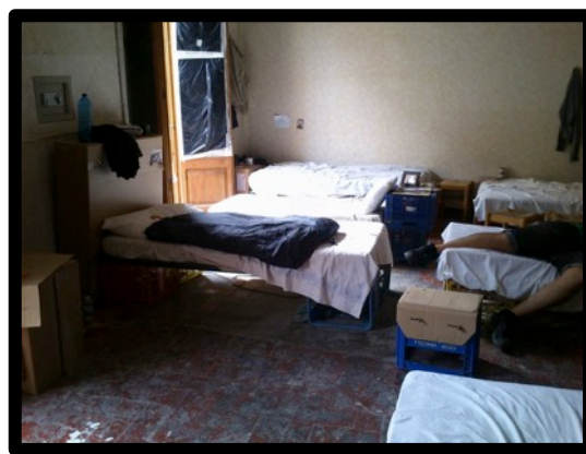
Espai de públic, la gent s'asseu als llits