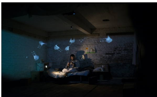
Espai d'actuació (Ex. 1)