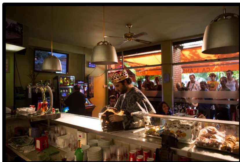
Exemple de bar on el públic observa l’acció des de fora a través de la finestra