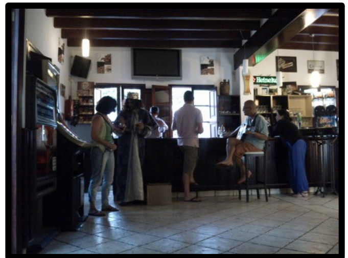
Exemple d’espai ampli per albergar el públic que observar l’acció des de lluny