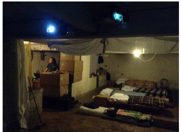
Espai de públic (Ex. 2)