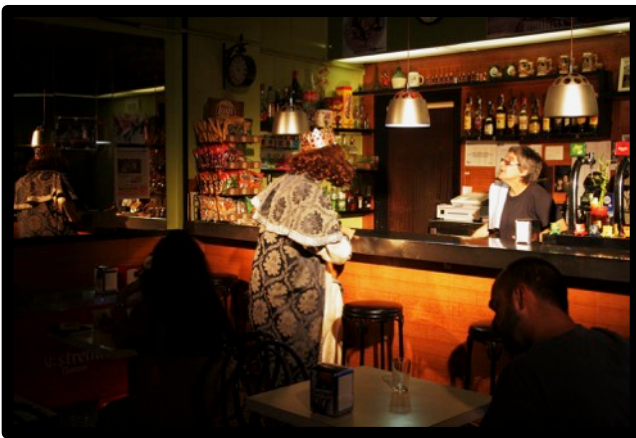
Exemple de bar “amb encant”

La duració de l’escena en aquest lloc és de 10 minuts.