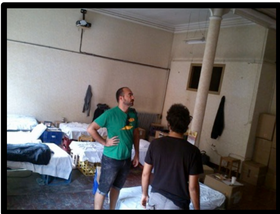
Espai de públi (Ex. 1)

Aquest espai haurà d'estar disponible des de sis dies abans de la primera representació i durant els dies de funció.